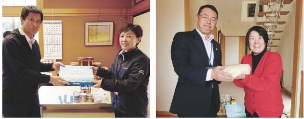
JA長野八ヶ岳女性部では毎年活動をしています。