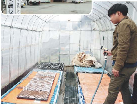
品種試験苗管理の様子