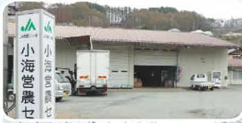
小海営農センター