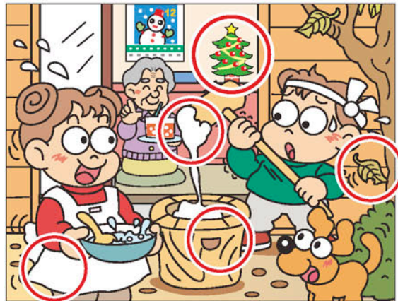
①ツリーの大きさが違う ②きねに付いている餅の量が少ない ③落ち葉の向きが違う ④エプロンのポケットがない ⑤白の取っ手の位置が違う