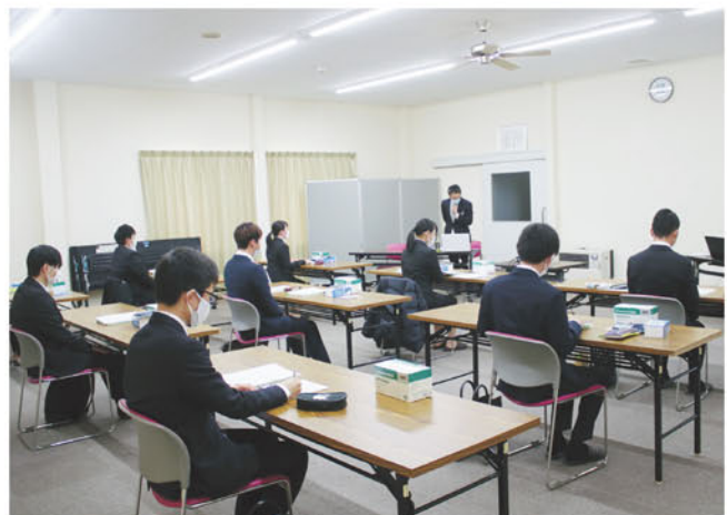
新採用職員の研修会の様子