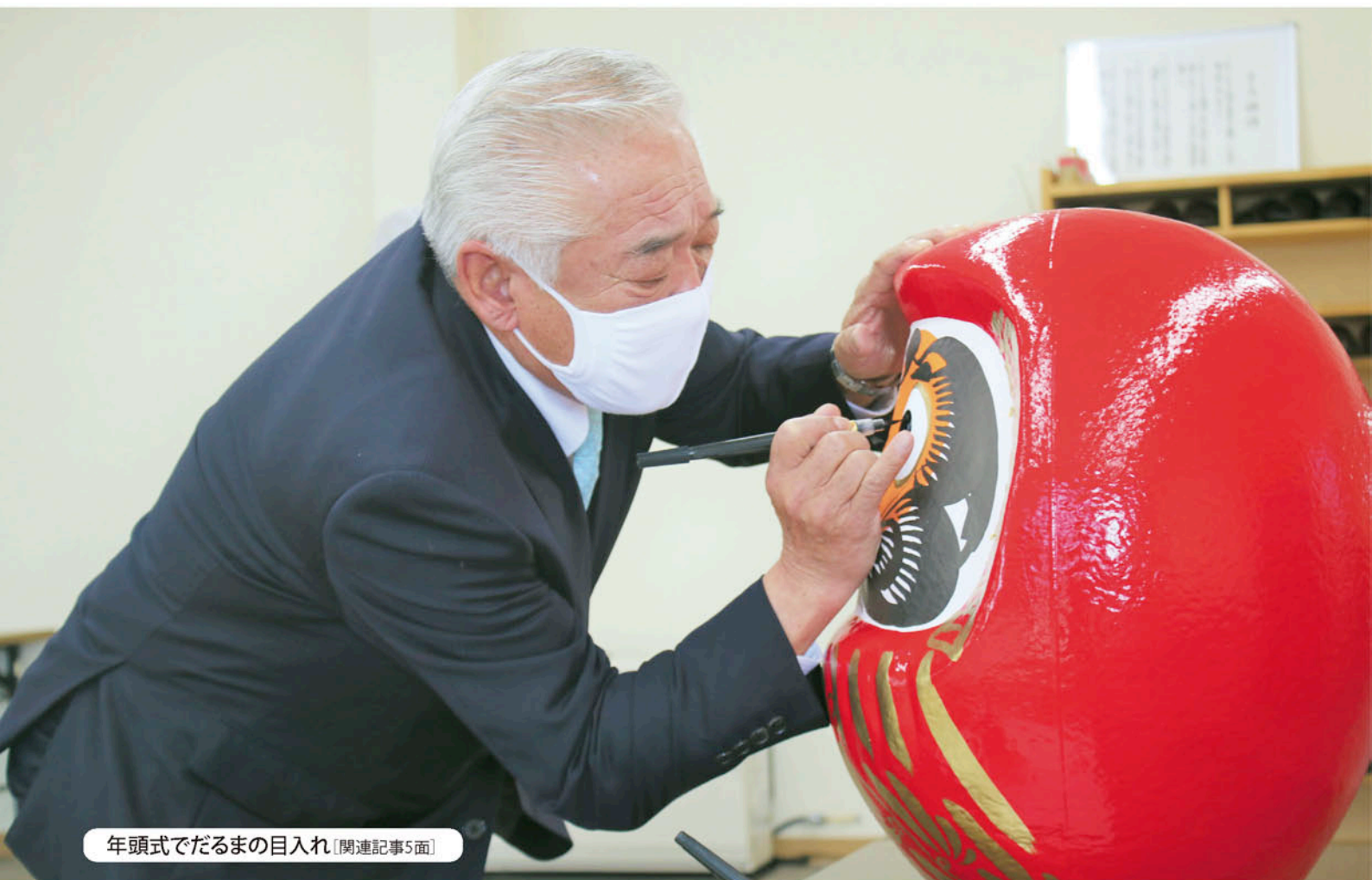
年頭式でだるまの目入れ [関連記事5面]