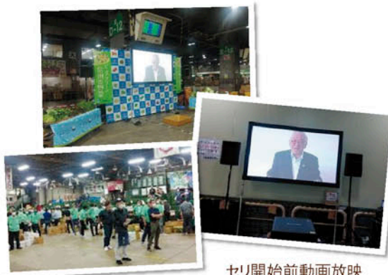
セリ開始前動画放映