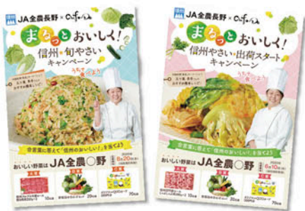
量販店の店頭で使用した応募ハガキ