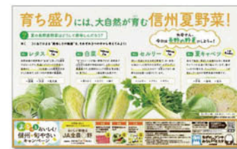
朝日新聞(全国版)での信州野菜PR