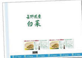
はくさい包装用フィルム

新型コロナウイルス感染症拡大により、スーパー店頭での試食宣伝会は実施できませんでしたが、キュービー株式会社をはじめとする食品メーカーとタイアップを行ない、レシピリーフレット等の店頭販促資材を使った取り組みやドレッシング等の試供品提供による食べ方提案を行ないました。