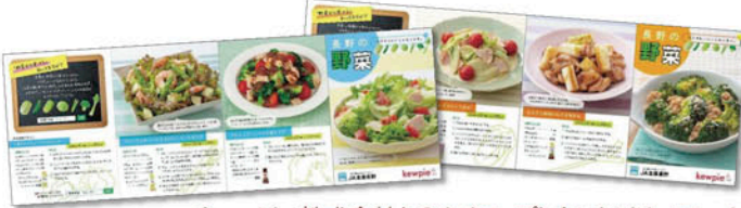
キュービー株式会社とのタイアップしたレシピリーフレット