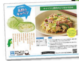
「おあじはかが」9月号