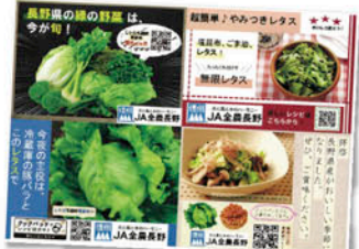
店頭で使用するQRコード付きPOP