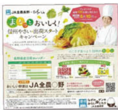
信濃毎日新聞でのキャンペーン告知