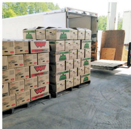
出荷物積み込み風景