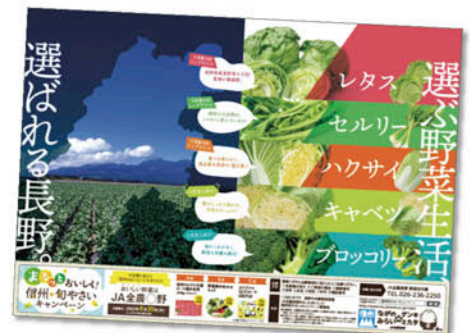
県内電車・バスの中吊り広告

今年度については、新型コロナウイルス感染症拡大により従来とは異なる状況での活動となりましたが、消費地の店頭では「信州フェア」と題した推奨販売やチラシ掲載、SNSや動画を使つてのPR活動の充実を図ってきました。 消費伝事業では、長野県産野菜の生産や健康面での野菜摂取の重要性、食べ方を消費者へPRし、将来的な消費拡大を図るとともに、コロナ禍における新たな生活様式に合わせた活動を検討していきます。