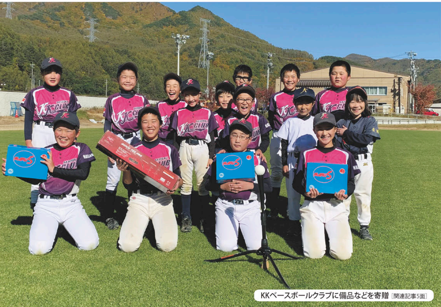
KKベースボールクラブに備品などを寄贈 [関連記事5面]

支所フォトニュース 事業所紹介 CONNECT 女性部ニュース やさいをたっぷりおいしくレシピ 「ロールハクサイ」 理事会報告 年金相談会開催 我が家のちゃいドル