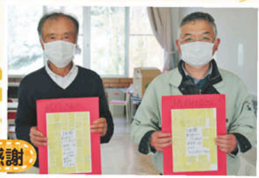
武川さんとJAに感謝