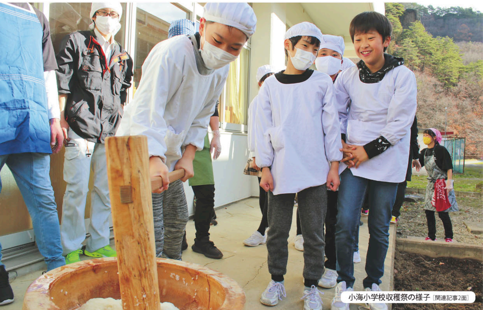
小海小学校収穫祭の様子 [関連記事2面]