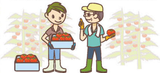
JA全中「JAグループの活動報告書2019」をもとに作成