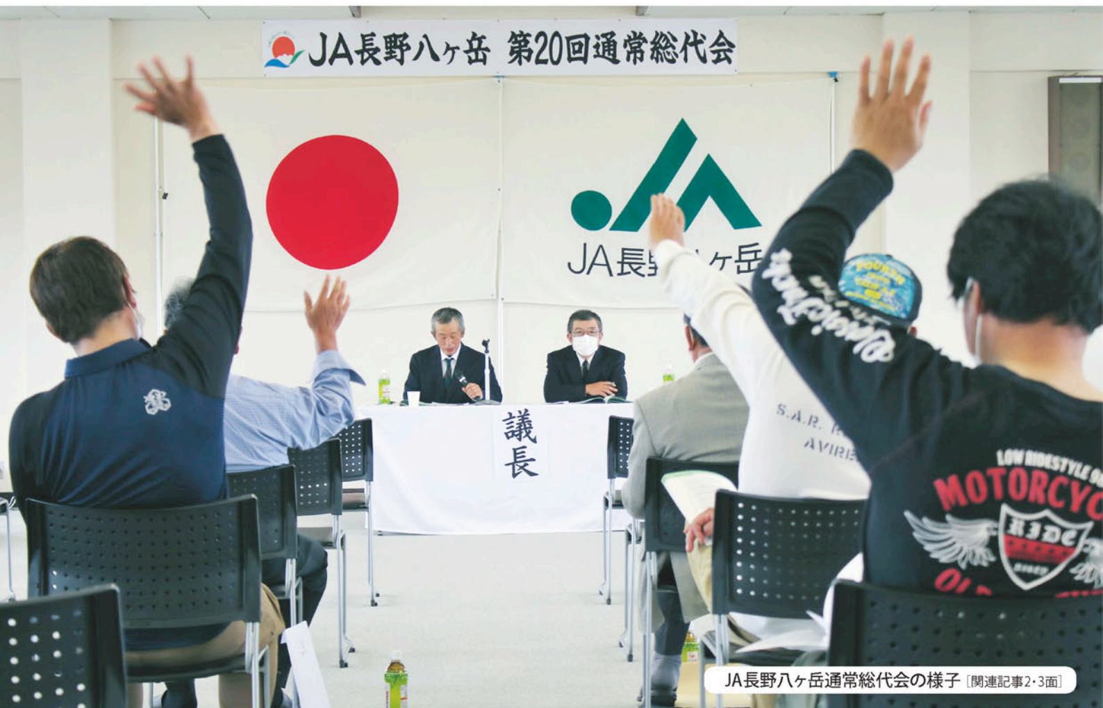
JA長野八ヶ岳通常総代会の様子 [関連記事2・3面]

家庭菜園『モロヘイヤ』 事業所紹介 CONNECT やさいをたっぷりおいしくレシピ 『誰にでも作れる 本格豆乳いちごアイス』 理事会報告 我が家のチャイドル