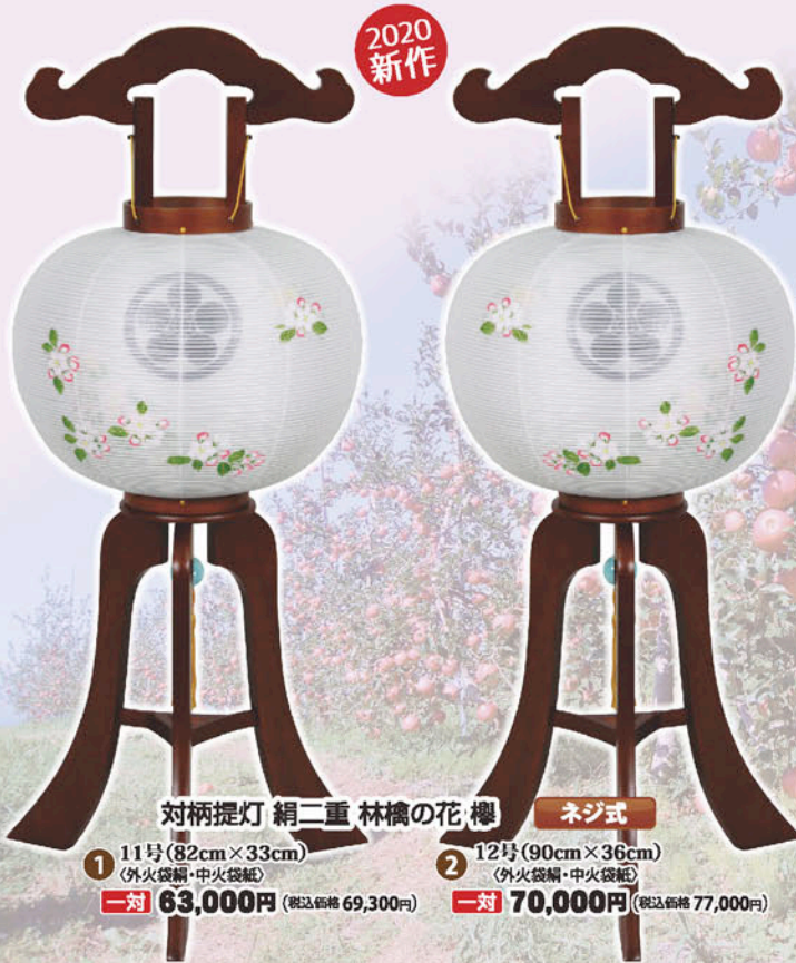
対柄提灯 絹二重 林檎の花 櫻