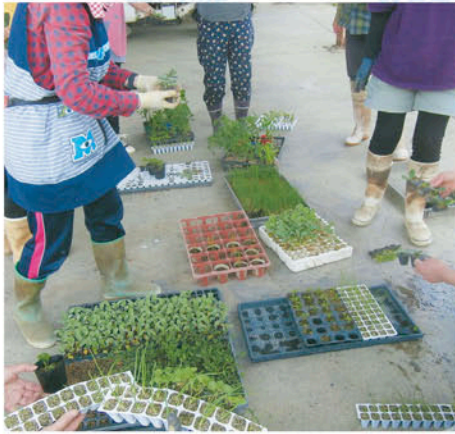
JAでは、女性の運営参画を推進しています。

新型コロナウイルス感染症の影響でいろいろな活動ができず、部員の皆さんと会うのが久しぶりだったこともあり、「たまには皆さんと会っておしゃべりをするのも大事ななあ」としみじみ感じた会となりました。