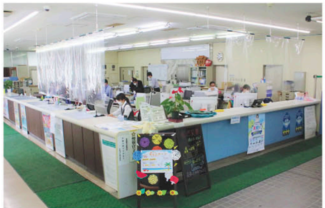
新型コロナウイルス感染防止対策として飛沫防止シートを設置した支所内の様子