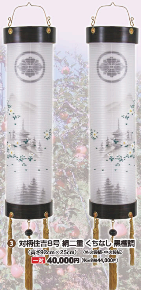
③ 対柄住吉8号 絹二重 ちなし 黒檀調

② 12号(90cm×36cm) (外火袋絹・中火袋紙) 一対 70,000円 (税込価格 77,000円)