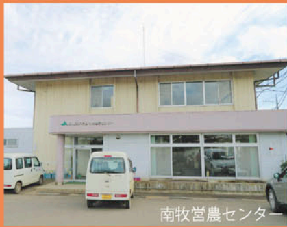
南牧宮農センター