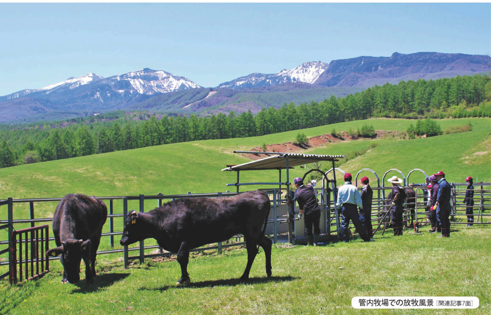
管内牧場での放牧風景 [関連記事7面]