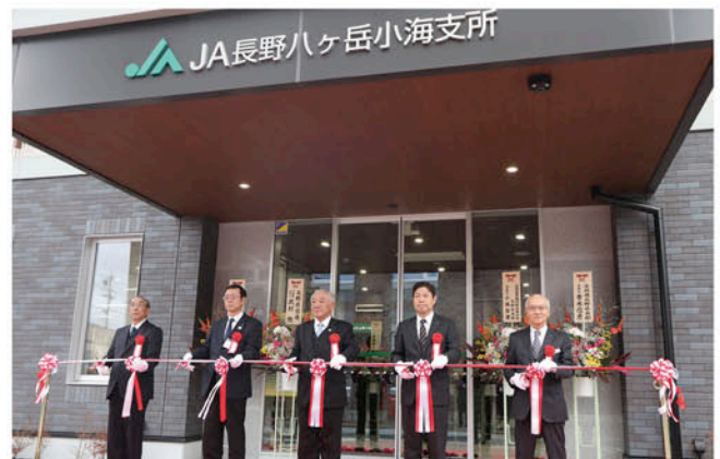
店舗オープンセレモニーでのテープカット