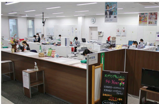
新しくなった店舗内の様子