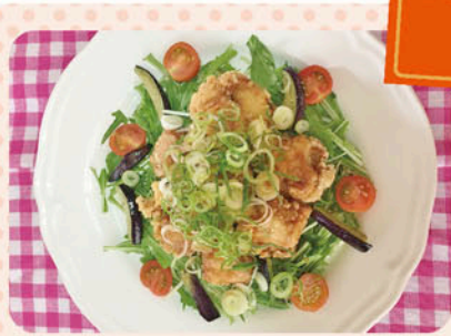
ユーズンチー 油淋鶏風から揚げ