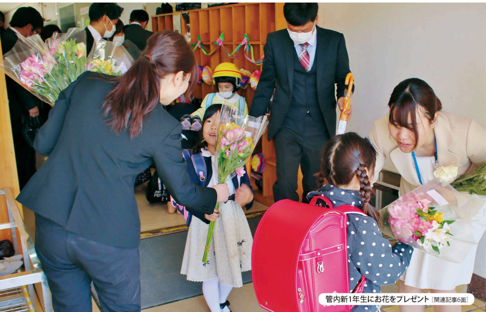
管内新1年生にお花をプレゼント [関連記事6面]