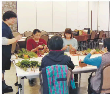
フラワーアレンジメント教室