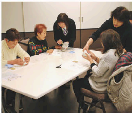
ポーセラーツ体験会