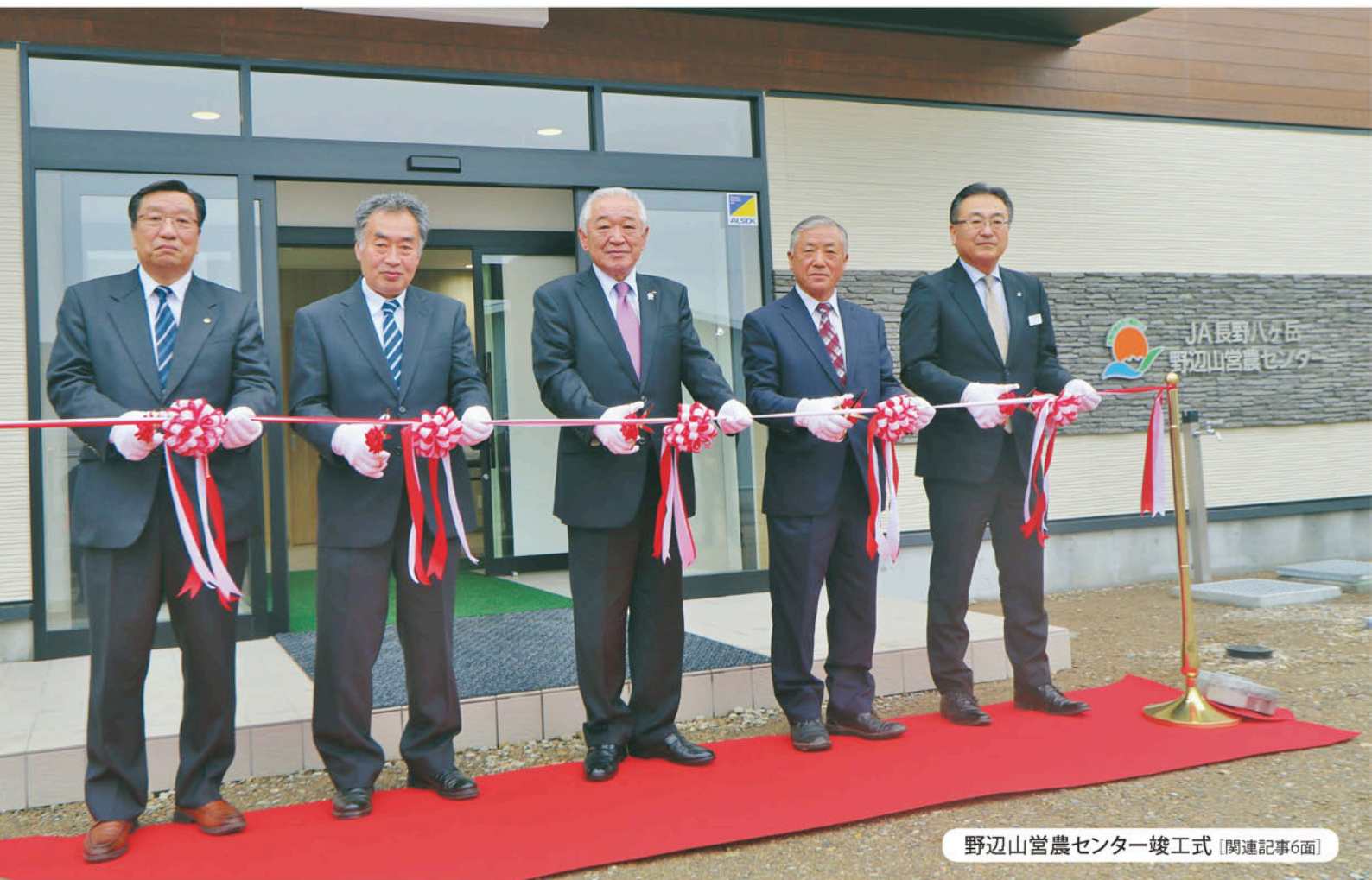
野辺山宮農センター竣工式 [関連記事6面]