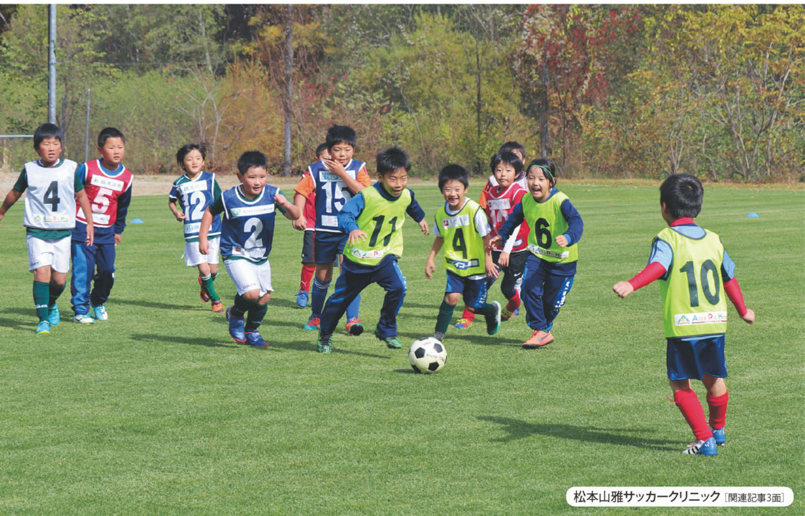
松本山雅サッカークリニック [関連記事3面]