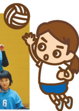
小海町クラブAチーム