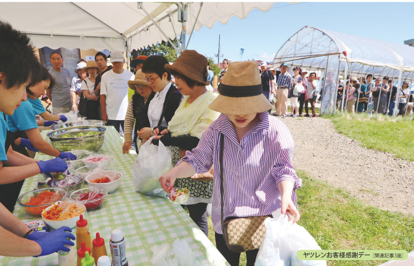
ヤツレンお客様感謝デー [関連記事3面]