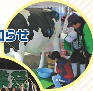
昨年の農業祭の様子▲

歌謡ショー・地元の皆さんによる踊りや太鼓演奏 ピンゴ大会などの各種イベント おでん・豚汁のサービスコーナー 地元野菜、牛肉、果物等の販売 など