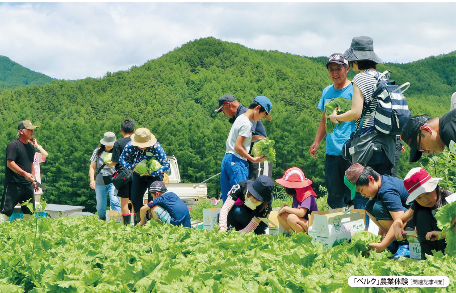
「ベルク」農業体験 [関連記事4面]