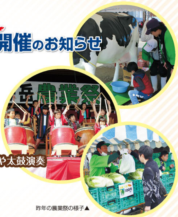
昨年の農業祭の様子▲

歌謡ショー・地元の皆さんによる踊りや太鼓演奏 ピシヨ大会などの各種イベント おでん・豚汁のサービスコーナー 地元野菜、牛肉、果物等の販売 など