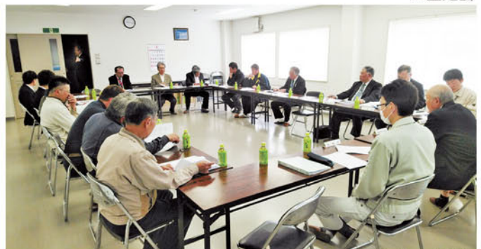
▲価格安定協議会総会