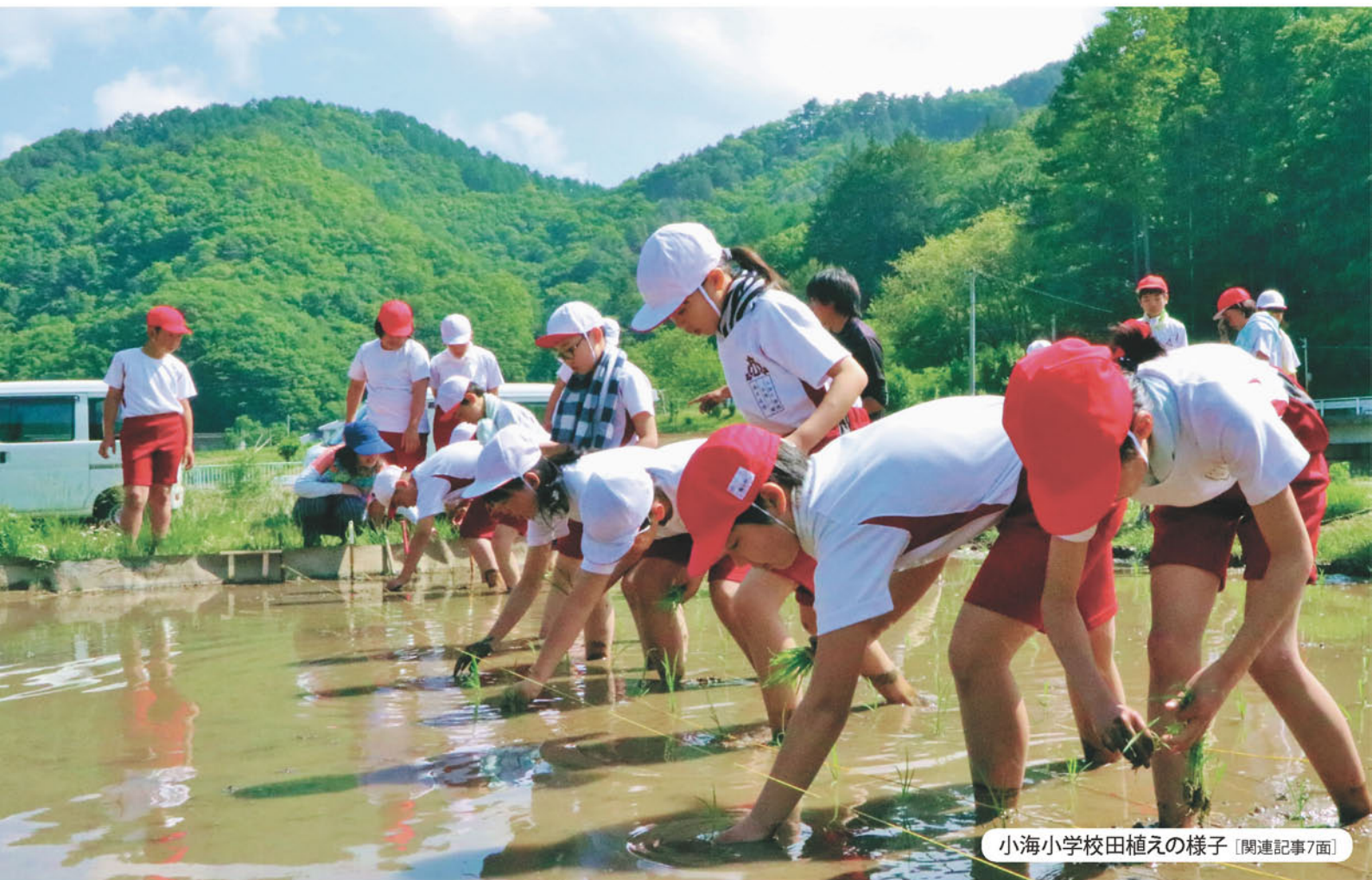
小海小学校田植えの様子 [関連記事7面]