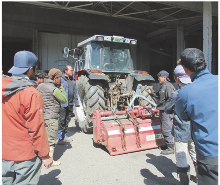
野辺山青年部「農機講習会」