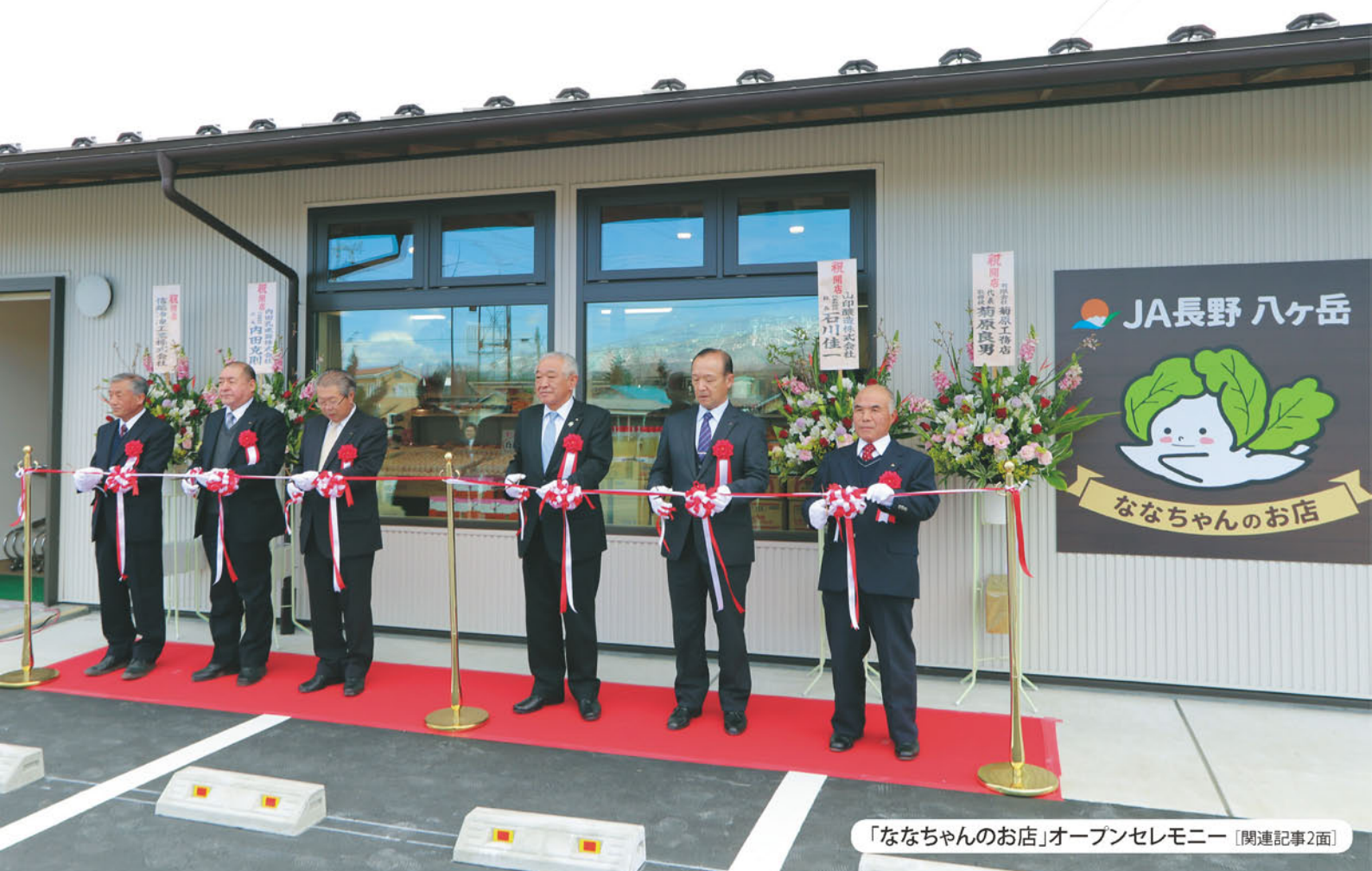
「ななちゃんのお店」オープンセレモニー [関連記事2面]