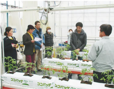
野辺山青年部「工場視察」