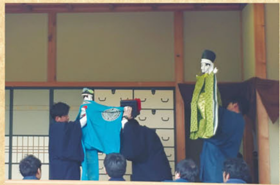
親沢の人形三番叟