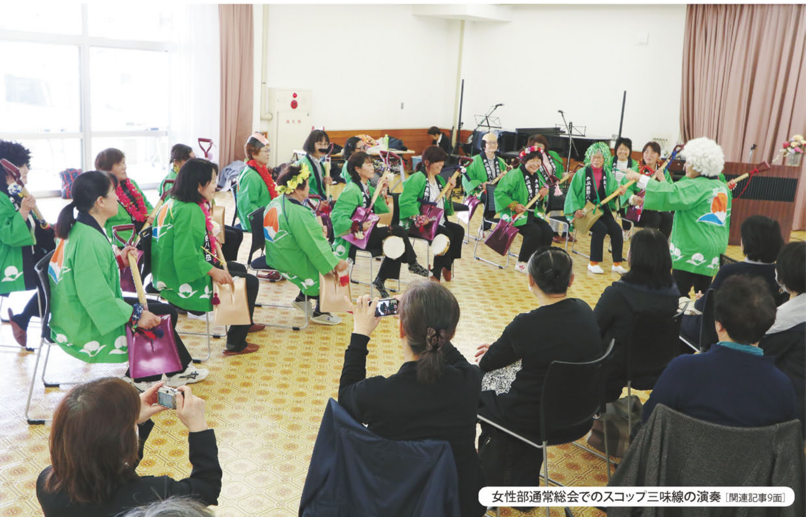
女性部通常総会でのスコップ三味線の演奏 [関連記事9面]