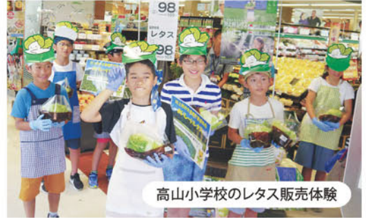
高山小学校のレタス販売体験