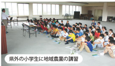
県外の小学生に地域農業の講習