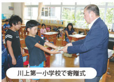
川上第一小学校で寄贈式

J A長野八ヶ岳では、管内の全小学校へ教育情報誌「ちゃぐりん」を寄贈しました。「ちゃぐりん」は農業・食・環境について気軽に学習できる教育図書で、子どもたちの夏休みの自由研究の教材として8月号を管内全小学校の5年生に寄贈しました。