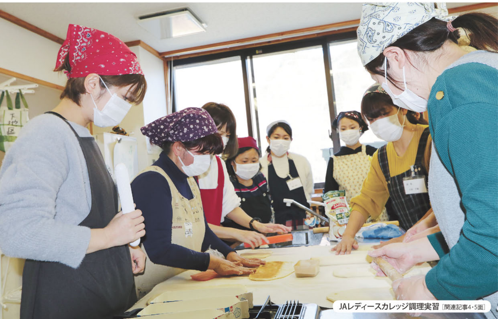
JAレディースカレッジ調理実習 [関連記事4・5面]