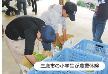
三鷹市の小学生が農業体験

支所管内の各出荷組合の皆さんにご協力いただき、東京三鷹市の小学校7校から800名の児童が農家を訪れて農業体験を行いました。同市の高山小学校では、農業体験で植えたレタスを市内の食品スーパーで児童の皆さんが対面販売しました。