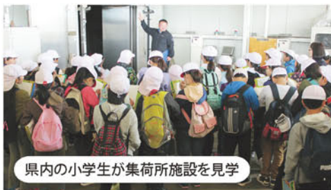
県内の小学生が集荷所施設を見学

農業部では、県内外の小学校など多くの子どもたちの集荷場施設見学を受け入れました。管内で生産される野菜の特徴や安心安全へのJAの取り組みについて講習を行ない、予冷施設を見学してコールドチェーン輸送について説明し、高冷地特有の農業を紹介しました。