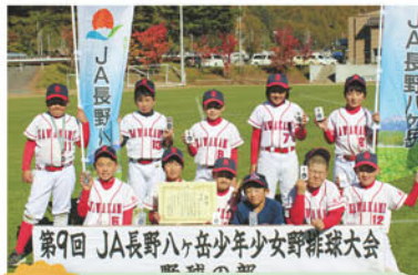
3位 川上少年野球チーム