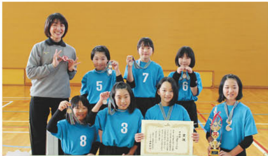
準優勝 小海町クラブAチーム