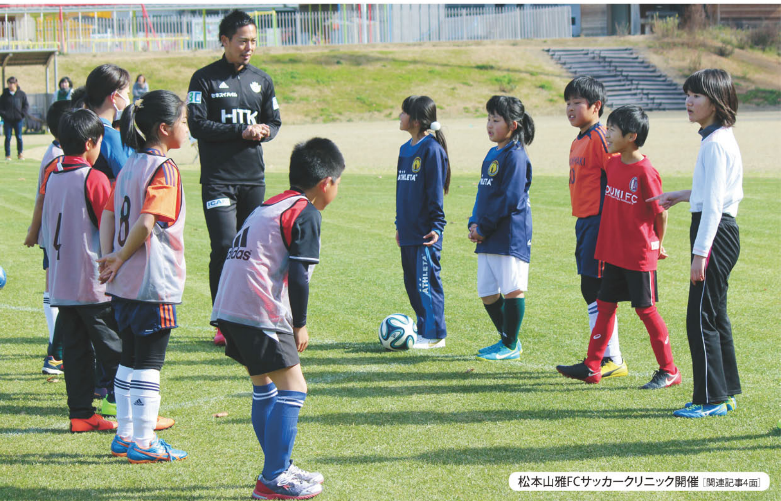
松本山雅FCサッカークリニック開催 [関連記事4面]

支所フォトニュース 一所懸命 女性部ニュース やさいをたっぷりおいしくレシピ 「大根の皮のきんぴら」 年金相談会開催 理事会報告 我が家のチャイドル