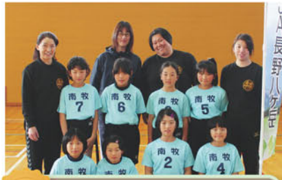
5位 南牧ジュニアBチーム