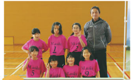
5位 南あいきチーム