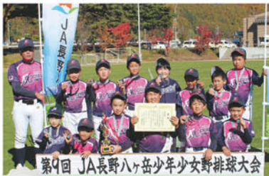
準優勝 KKベースボールクラブBチーム