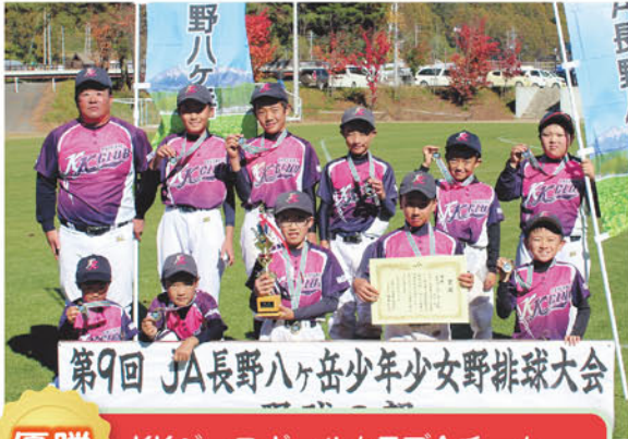
優勝 KKベースボールクラブAチーム

当日は肌寒い陽気となりましたが、子どもたちの真剣なプレーと保護者の皆さんの熱心な声援が会場を盛り上げました。試合は、4チームのトーナメント制で行ない、決勝戦は、小海町、南牧村、北相木村、南相木村の小学生が加入するKKベースボールクラブのAチームとBチームで熱戦を繰り広げ、6対0で昨年に続き4連覇を果たしました。