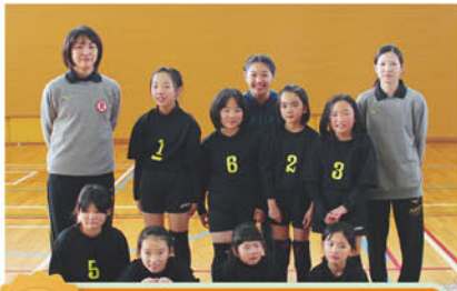
4位 小海町クラブBチーム