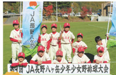
4位 居倉少年野球チーム