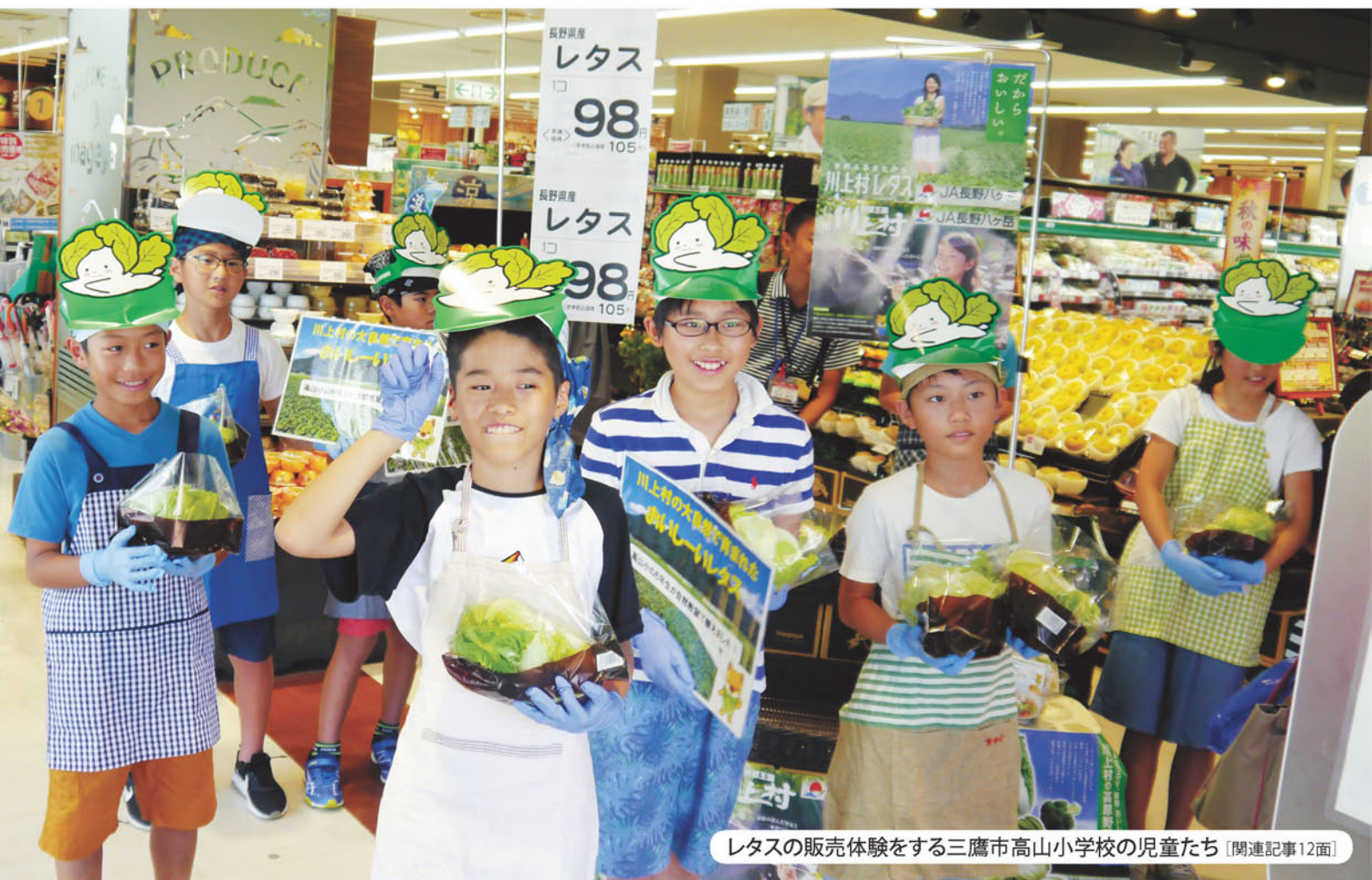
レタスの販売体験をする三鷹市高山小学校の児童たち [関連記事12面]