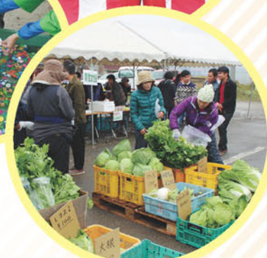
昨年の農業祭の様子▲