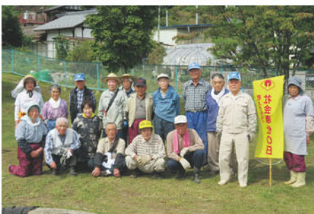
中央地区の皆さん

JA長野八ヶ岳管内の老人クラブ発足は、北相木村が昭和34年、南相木村が昭和36年、その後、各地区続々と長野県老人クラブ連合会へと届け出され現在に至っています。 各地区での参加人数や活動計画は様々ですが、発足以降幾星霜の間、浮き沈みあり躍動ありと歴史的な厚みを感じられます。 活動内容の一例ですが、村内の中央老人クラブでは今年度も4月より健康ウォーキングを計画しました。初回の内容は「ラジオ体操」「ウォーキング」「ストレッチ体操」を行ない、以降毎月第2、第4水曜日に実施するなど、それぞれ地区ごとに人数や