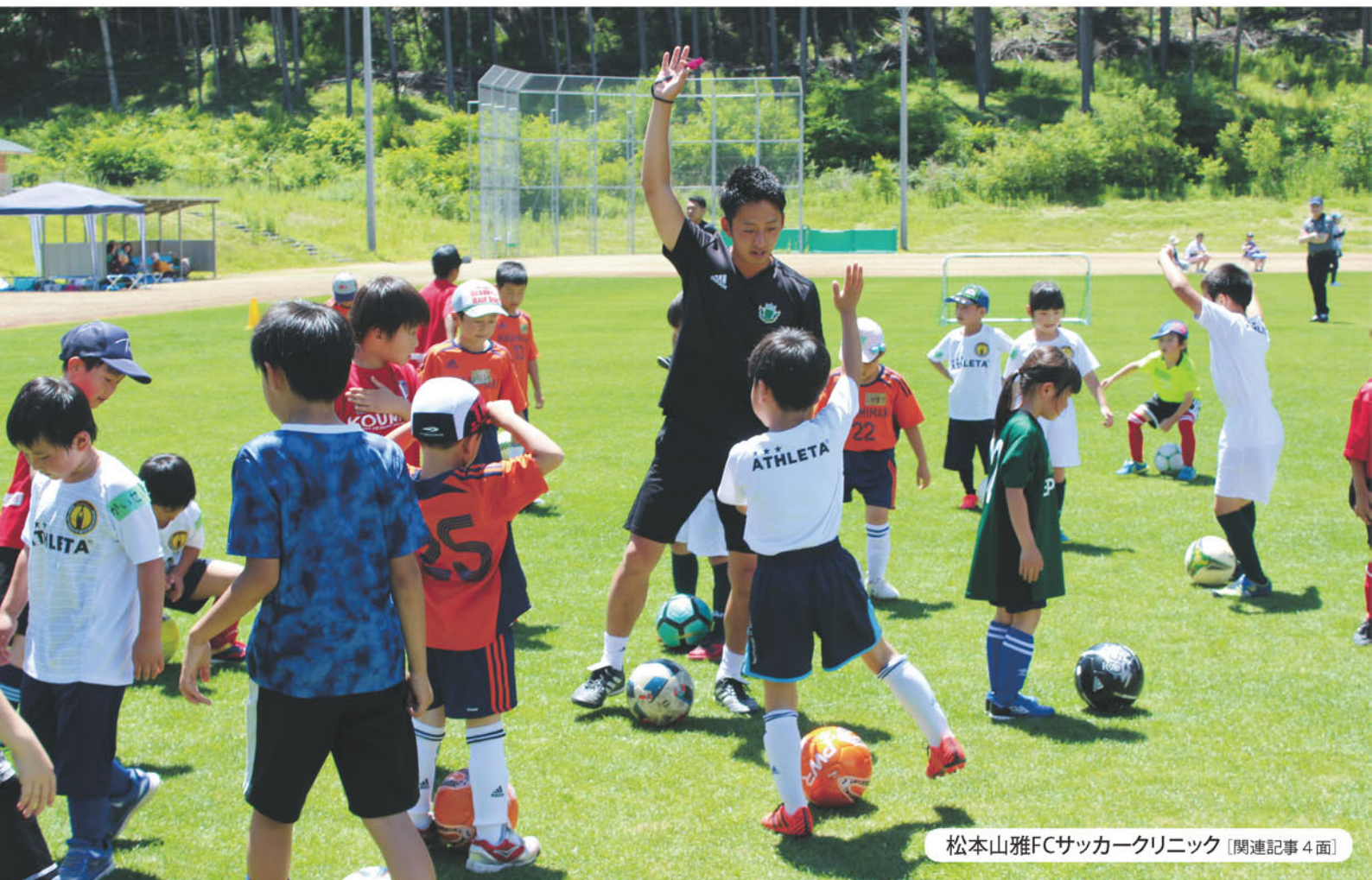
松本山雅FCサッカークリニック [関連記事 4面]