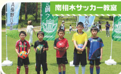
南相木サッカー教室