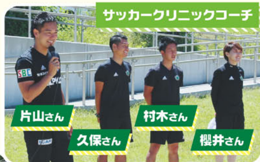
サッカークリニックコーチ

参加した各チームの児童の皆さん、保護者ならびに関係者の皆さん、大変お疲れさまでした。