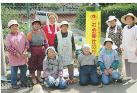
第八地区の皆さん