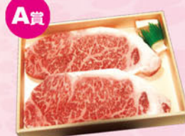
A賞 信州和牛 サーロインステーキ (180g×2枚)