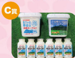
C賞 ヤツレン 乳製品詰め合わせ

なお、併せて実施しましたアンケートでは、広報誌「レタス」をはじめ、JAの各事業に対する貴重なご意見を多数お寄せいただきありがとうございました。今後のJA事業および広報活動に反映させていただきます。これからも広報誌「レタス」をよろしくお願いたします。