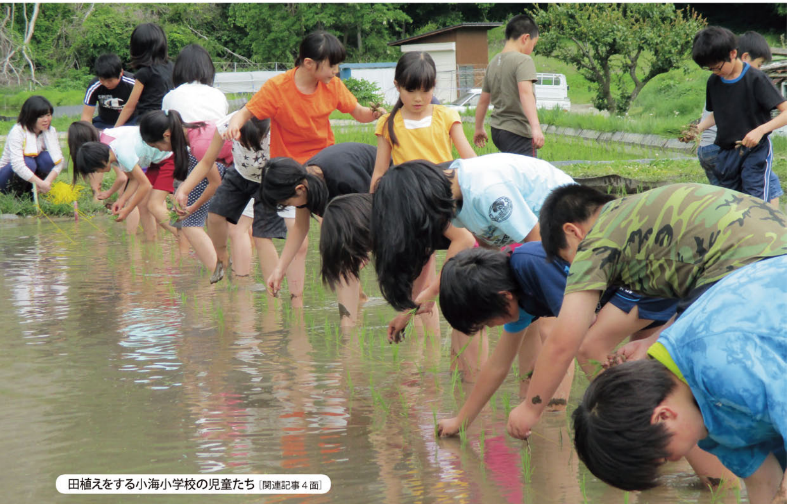
田植えをする小海小学校の児童たち [関連記事4面]

支所フォトニュース 一所懸命 女性部ニュース やさいをたっぷりおいしくレシピ 「レタスと豚肉のしゃぶしゃぶ」 家庭菜園「ほうれん草」 理事会報告 我が家のちやいドル