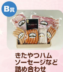
B賞 きたやつハム ソーセージなど 詰め合わせ