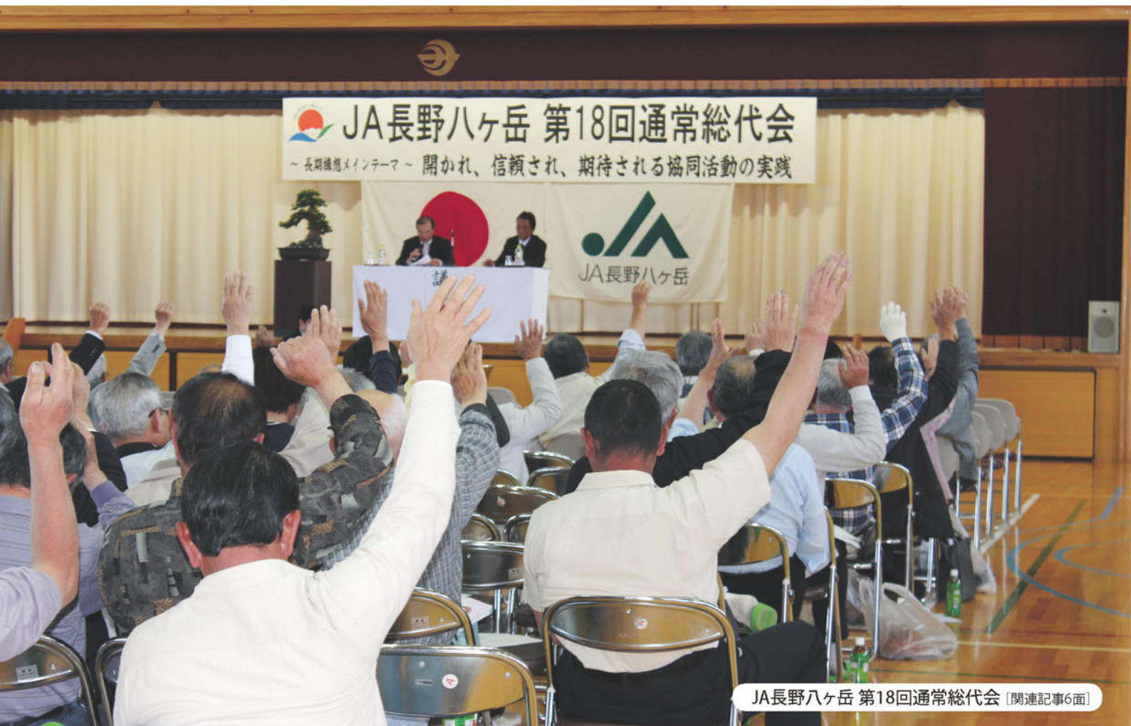
JA長野八ヶ岳 第18回通常総代会 [関連記事6面]

家庭菜園「サツマイモ」 理事会報告 支所フォトニュース 一所懸命 女性部ニュース やさいをたっぷりおいしくレシピ 「アスパラガスとしめじの湯葉和え」 年金相談会開催 我が家のチャイドル