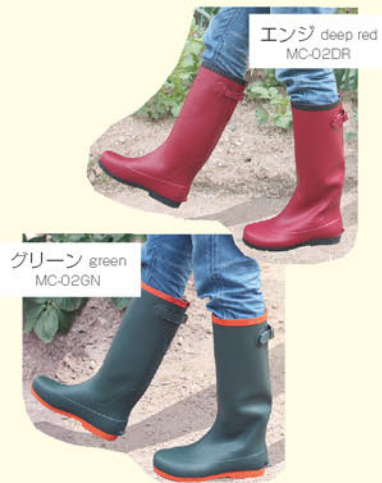
エンジ deep red MC-02DR