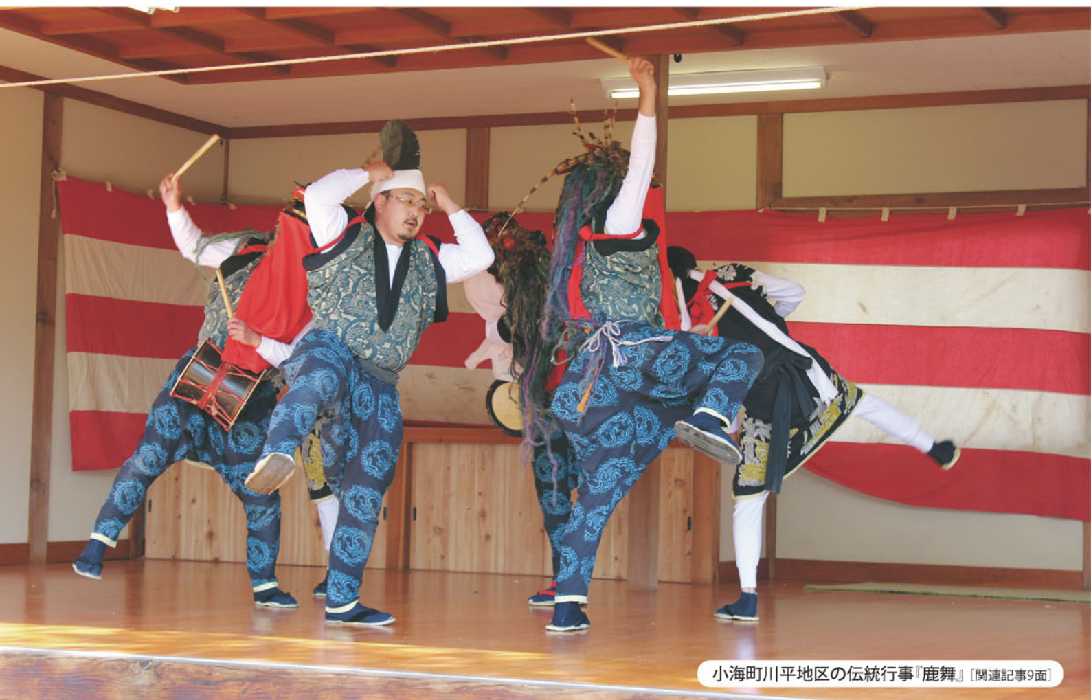
小海町川平地区の伝統行事『鹿舞』 [関連記事9面]

理事会報告 家庭菜園『ジャガイモ』 支所フォトニュース 一所懸命 女性部ニュース やさいをたっぷりおいしくレシビ 『みたらし五平もち』 年金相談会開催 我が家のちゃいドル