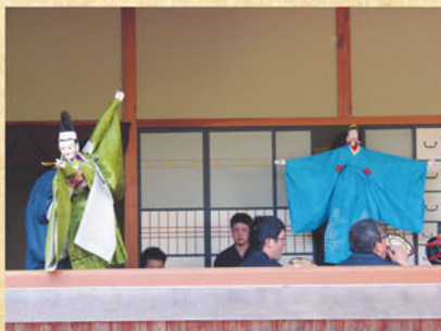
親沢の人形三番叟

4月8日、小海町の川平、親沢地区で250年以上前から引き継がれている「川平の鹿舞」「親沢の人形三番叟」が、親沢の諏訪神社において上演されました。川平の鹿舞(ししまい)は悪魔祓いをするもので、笛や鼓の音色に合わせて歌を唄い、役者と呼ばれる6