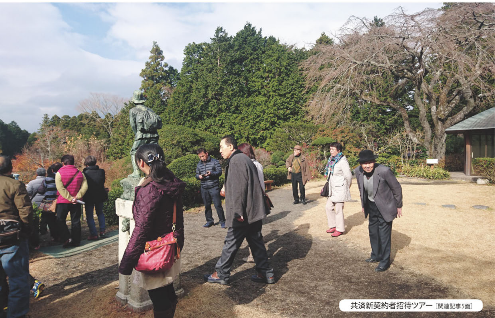
共済新契約者招待ツアー [関連記事5面]