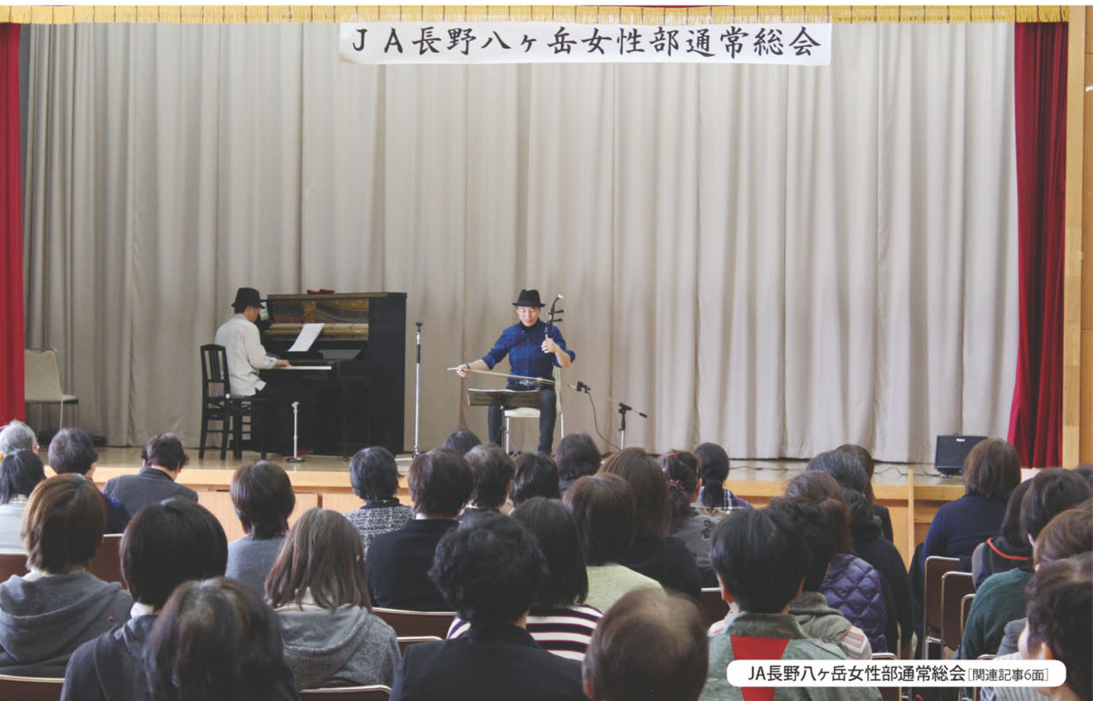
JA長野八ヶ岳女性部通常総会 [関連記事6面]