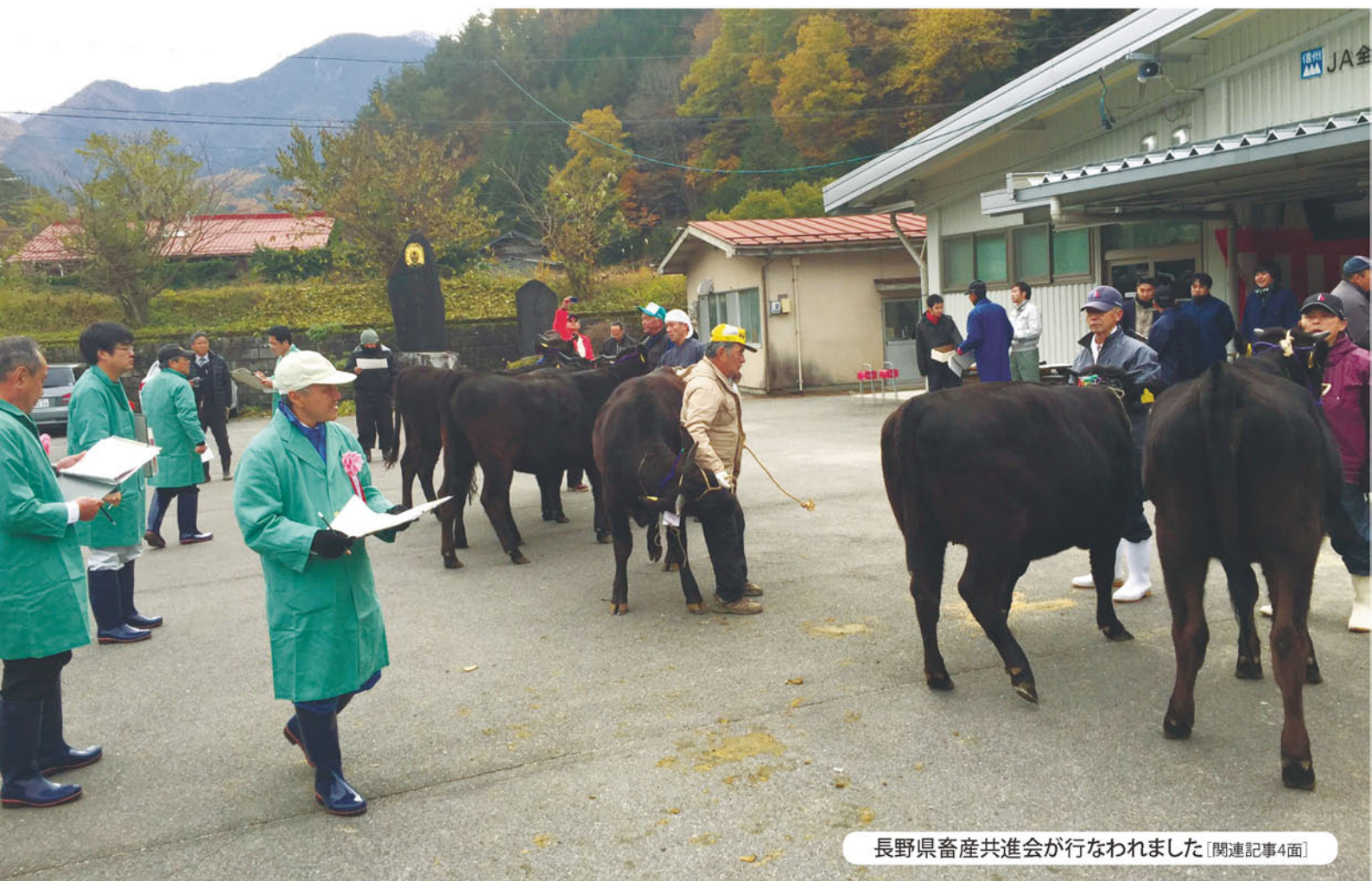
長野県畜産共進会が行なわれました [関連記事4面]