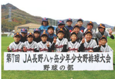
第7回 JA長野八ヶ岳少年少女野球大会 野球の部