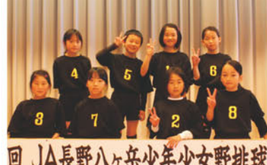
17回 JA長野ハヶ岳少年少女野排球大会 バレーボールの部