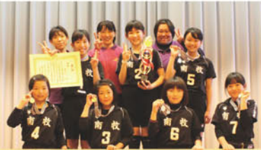
17回 JA長野ハヶ岳少年少女野排球大会 バレーボールの部