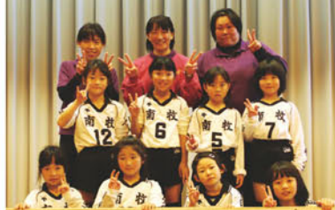
17回 JA長野ハヶ岳少年少女野排球大会