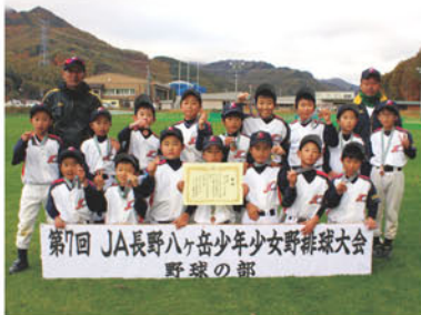
第7回 JA長野八ヶ岳少年少女野球大会 野球の部