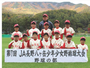
第7回 JA長野八ヶ岳少年少女野球大会 野球の部