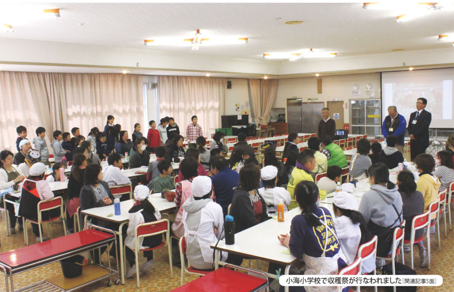
小海小学校で収穫祭が行なわれました [関連記事5面]