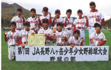
第7回 JA長野八ヶ岳少年少女野球大会 野球の部

●KKベースボールクラブA… 2勝0敗 ●川上スワローズ…………… 1勝1敗 ●居倉…………… 0勝2敗