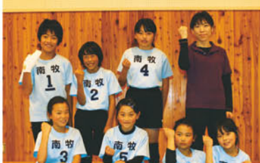
17回 JA長野ハヶ岳少年少女野排球大会