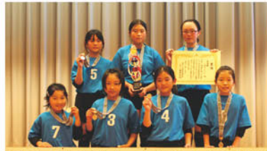
17回 JA長野ハヶ岳少年少女野排球大会 バレーボールの部