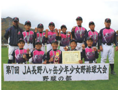
第7回 JA長野八ヶ岳少年少女野球大会 野球の部

参加された選手の皆さん、応援していただいた保護者の皆さん、大変お疲れさまでした。