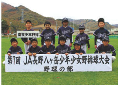
第7回 JA長野八ヶ岳少年少女野球大会 野球の部