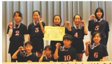
17回 JA長野ハヶ岳少年少女野排球大会 バレーボールの部