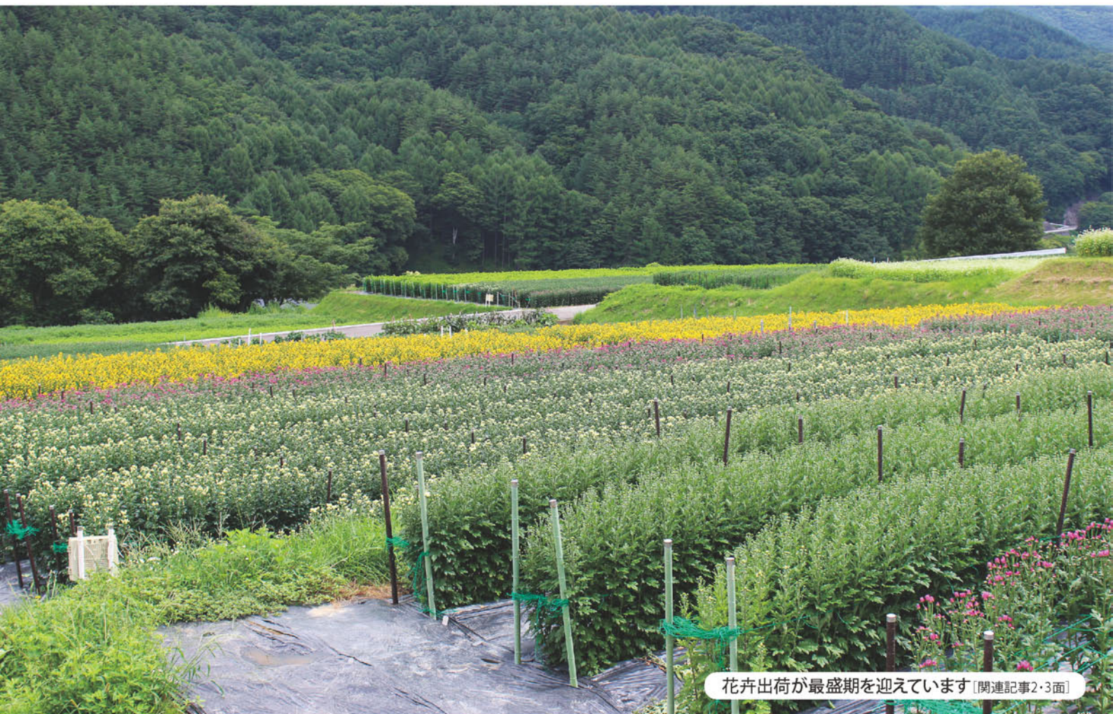
花卉出荷が最盛期を迎えています [関連記事2・3面]