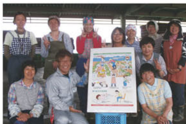
▲南牧支所板橋地区