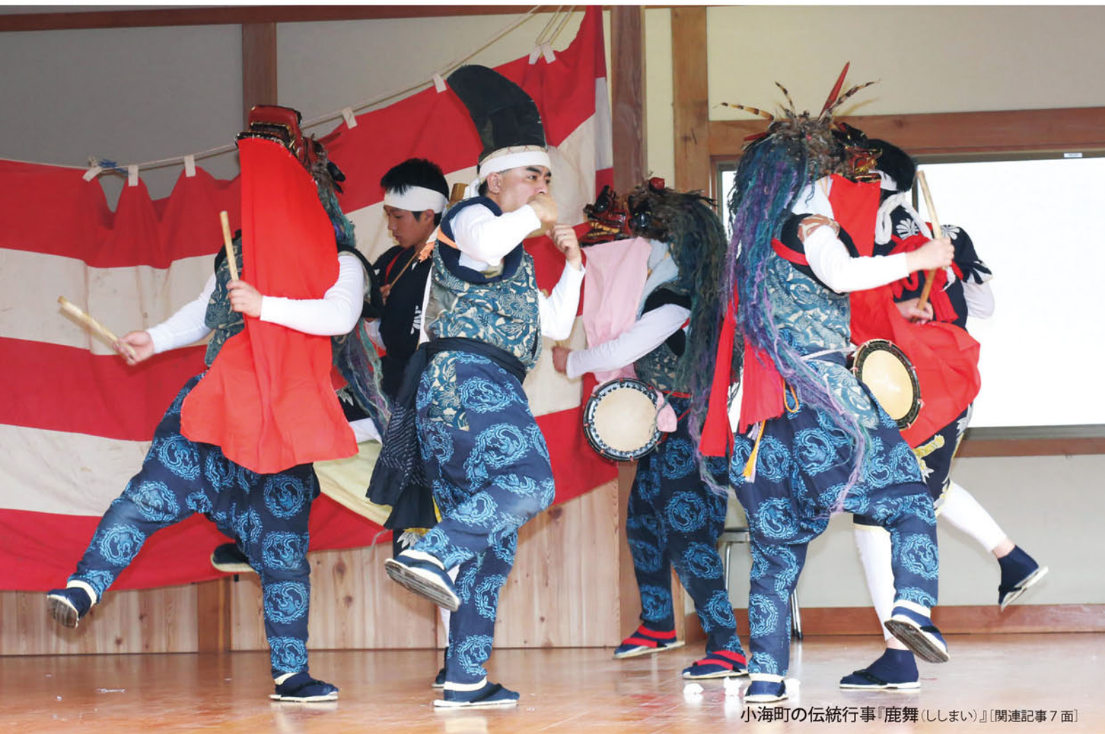
小海町の伝統行事「鹿舞(ししまい)」〔関連記事7面〕

家庭菜園「パセリ」 理事会報告 支所フォトニュース 女性部ニュース やさいをたっぷりおいしくレシビ 「担々風味のロールハクサイ」 我が家のチャイドル