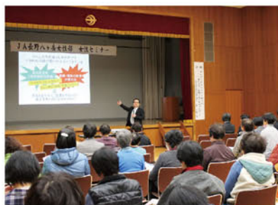
女性部主催女性セミナー