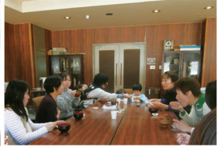
栄養・健康の講義と 味噌汁の試食会