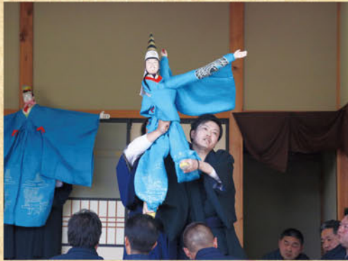
親沢の人形三番叟