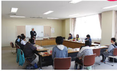
おやつ作り・交流会・閉校式

「草もち」「イチゴ大福」など和菓子を作りました。交流会では作ったお菓子を食べながら今後の活動について話し合いました。