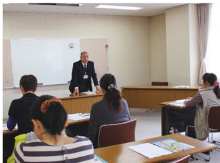
開校式・JAについて

4月15日には、南牧村の野辺山基幹集落センターにおいて修了式が行なわれ、この日出席した受講生一人ひとりに修了証が手渡され、受講生の皆さんからは「小さい子ども連れでも温かく迎えてくれた」「村外の方と繋がりができた」「普段できないことを体験できた」など、半年間の思い出を振り返りながら、様々な感想をいただきました。