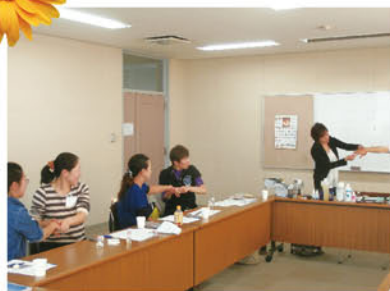
生活と子育てに役立つアロマ

ハーブとアロマを楽しみながら、心身を健康にするセラピーでリラックスしていただきました。