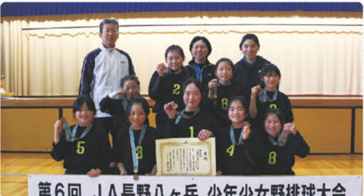
第6回 JA長野八ヶ岳 少年少女野球大会