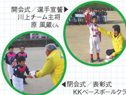
閉会式／表彰式 KKベースボールクラブ