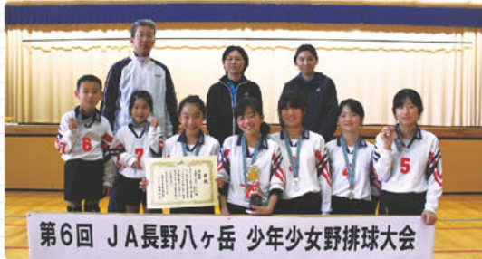
第6回 JA長野八ヶ岳 少年少女野球大会

決勝戦は、これまで3回優勝した南牧Aチームが、小海町小学生バレーボールクラブAをセットカウント2-0で下し、4度目の優勝を決めました。 保護者やチームメイトの大きな声援で会場は盛り上がり、試合後には「悔し涙」や「嬉し涙」を流す子どもの姿も……。皆、精一杯がんばりました。