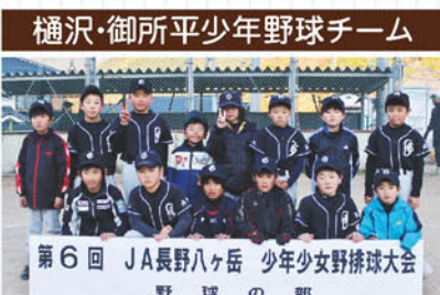
樋沢・御所平少年野球チーム