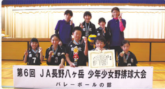
第6回 JA長野八ヶ岳 少年少女野球大会 バレーボールの部