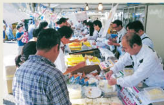
▲大盛況の詰め放題売り場

近年は、人口の減少や、飲料の多様化等に伴い、牛乳の消費の落ち込みが見られますが、牛乳やヨーグルトをはじめとする乳製品は様々な栄養素を豊富に含んだ食品であることや、牛乳のもつ「価値」というものを正確にお伝えしながら、これからも消費者の皆さまとのふれあいを大切に、より多くの皆さまの豊かな食生活と健康づくりに貢献してまいります。