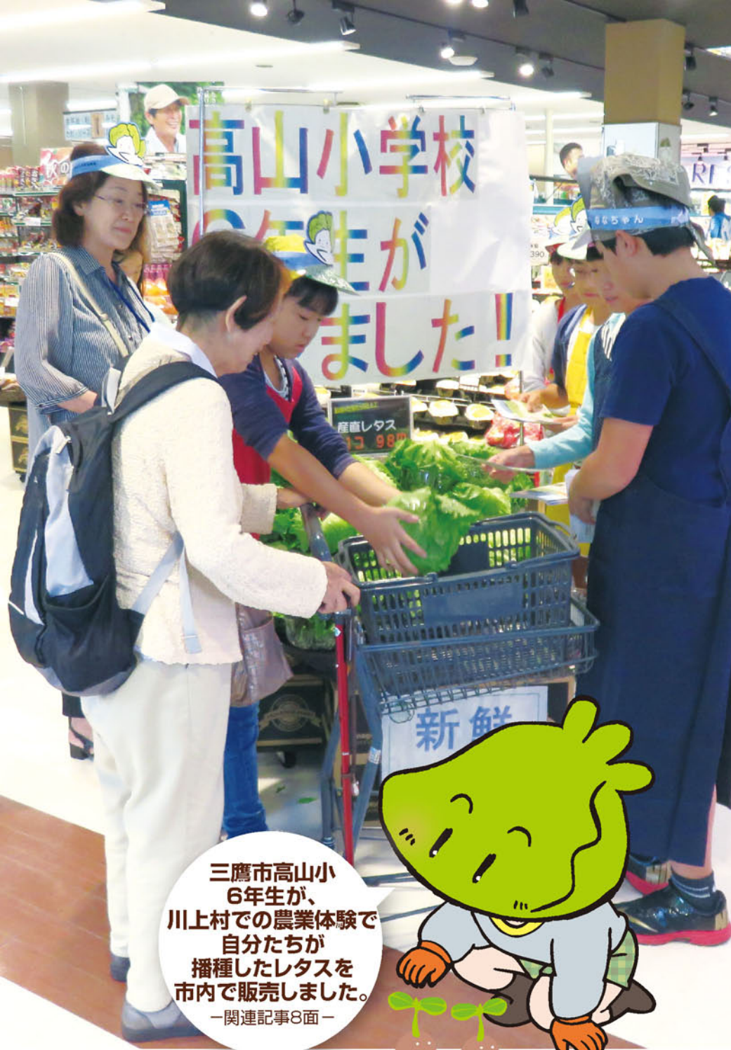
三鷹市高山小 6年生が、 川上村での農業体験で 自分たちが 播種したレタスを 市内で販売しました。 —関連記事8面—