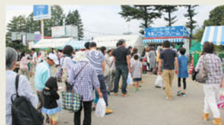
▲ソフトクリーム売店前の行列

感謝祭ではヤツレン製品のほとんどが2割引で販売され、人気商品の「ポツポ牛乳」「のむヨーグルト」は約3割引で販売されました。また、会場の各ブースではレアチーズケーキやラスク・サブレなどの詰め放題や手作りバターの体験コーナー、酪農部会女性部による牛丼、カレーライスの販売などが行なわれしました。毎年、売店前に長蛇の列ができる名物のソフトクリームは、2日間で2,000個以上を売り上げ、恒例となった豚の丸焼きサービスも10分足らずで品切れとなるほどの盛況ぶりでした。「感謝祭を毎年楽しみにしている」「たくさん面白い物ができた」と話す来場者も多く、イベントを満喫して