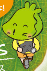
Photo News フォトニュース