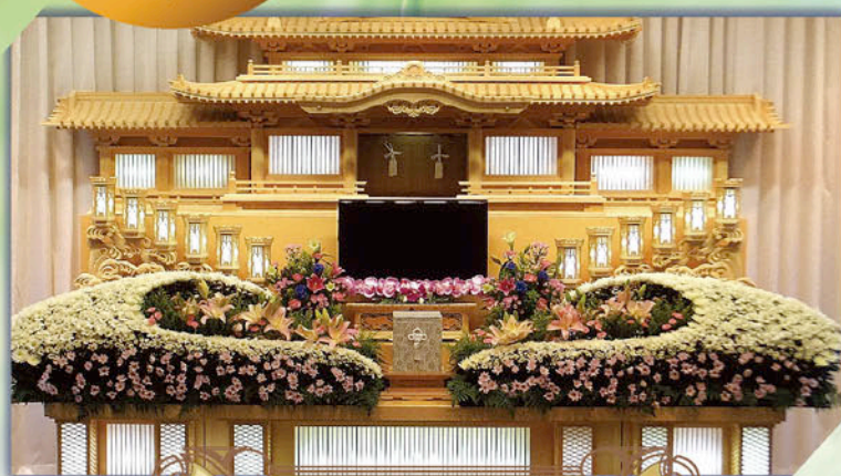
オリジナル 生花祭壇 雲竜