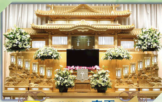
オリジナル 生花祭壇 青雲