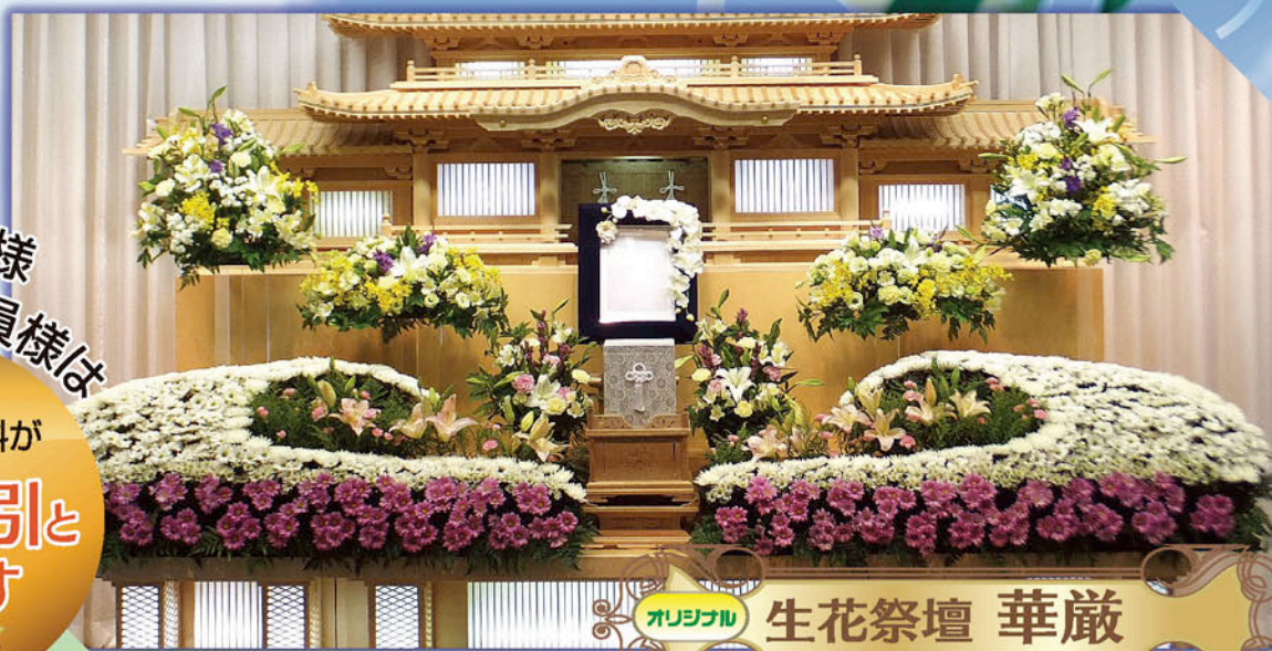
オリジナル 生花祭壇 華厳