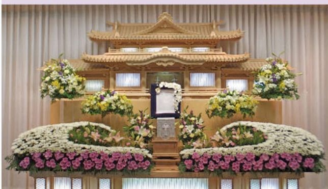
オリジナル生花祭壇「華厳」