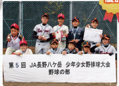
第5回 JA長野八ヶ岳 少年少女野球大会 野球の部