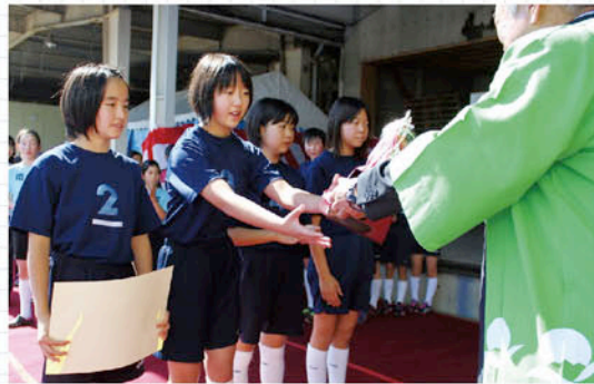
〔表彰式〕優勝の南あいきチーム