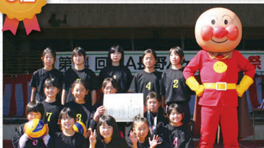
第5回 JA長野八ヶ岳 少年少女野球大会