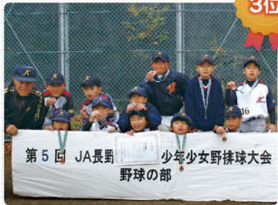
第5回 JA長野 少年少女野球大会 野球の部