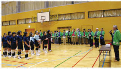
バレーボールの部開会式