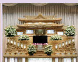
オリジナル生花祭壇「青雲」