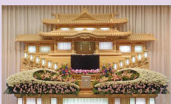
オリジナル生花祭壇「雲竜」