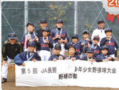
第5回 JA長野 少年少女野球大会 野球の部