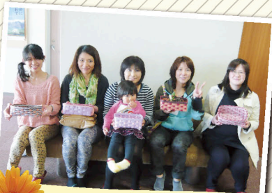
卒業制作(クラフトかご作り)