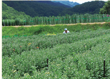
(左から、小海町、北相木村、南相木村の花卉圃場)