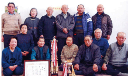
加佐地区ゲートボール仲間の皆さん

今年2月の大雪に始まり、4月の長雨、低温7月の旱魃など、農家の皆さんは大変な苦労をされています。野菜も花卉も、高値安定で推移してほしいと思います。TPP交渉も本格化し、またJA改革の議論などにより、多くの農家や農業関係者が心配するところです。JAを中心に反対運動を展開していますが、私も反対運動に同感です。将来に期待を持てるJA長野八ヶ岳の運営に期待しますが、余りに振込詐欺による被害が多く驚いています。JAから「信州だまされない宣言」のチラシが届きました。最近の手口が多様化しているようです。皆さん十分注意しましょう。