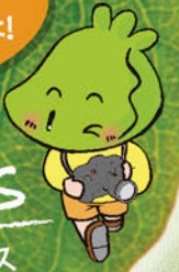
Photo News フォトニュース