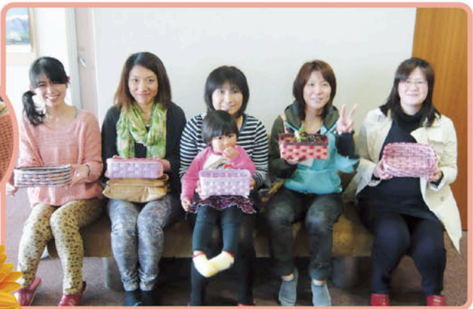
クラフトテープを切り、編み込み、貼り付け……時間をかけて丁寧に仕上げました。